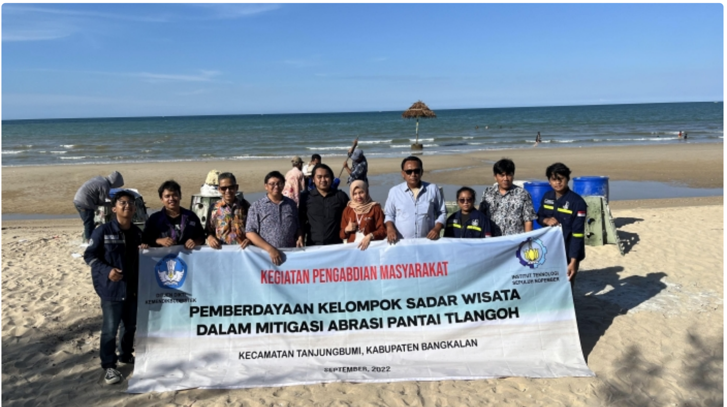
Tim KKN Abmas bersama dengan Kades Desa Tlangoh, Pokdarwis, dan Pertamina PHE WMO dalam kegiatan pemasangan Hexareef di Pantai Tlangoh

SURABAYA – Abrasi Pantai Tlangoh yang semakin memburuk beberapa tahun terakhir mengganggu perekonomian masyarakat sekitar. Berangkat dari masalah ini, Departemen Teknik Kelautan menggelar Pengabdian kepada Masyarakat (Abmas) merancang terumbu karang buatan di Desa Tlangoh, Madura.