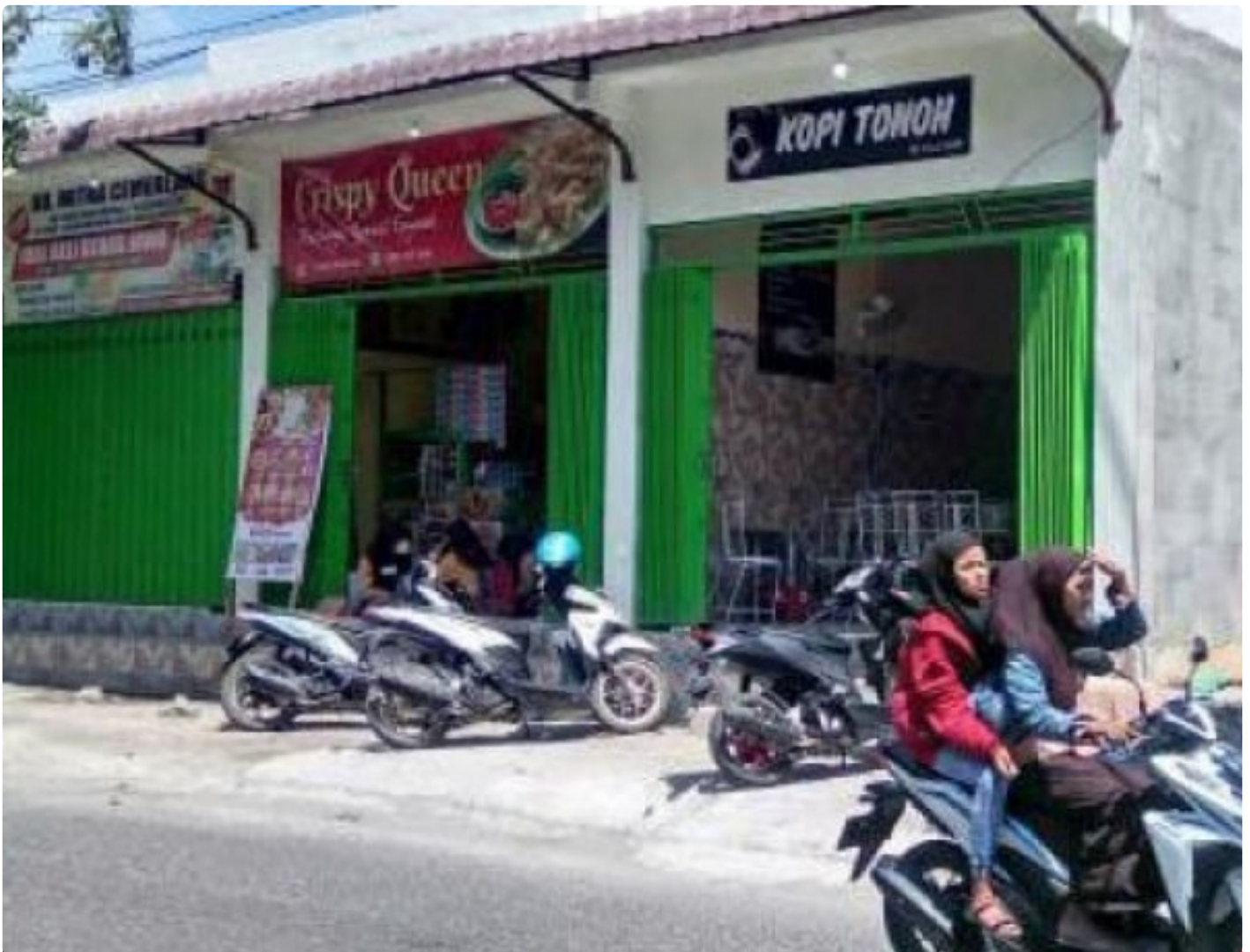
Bangunan ruko di atas Fasum / Fasos depan Perum Puri Matahari Sampang

Sampang - Belum adanya respon atau jawaban dari Developer pengembang